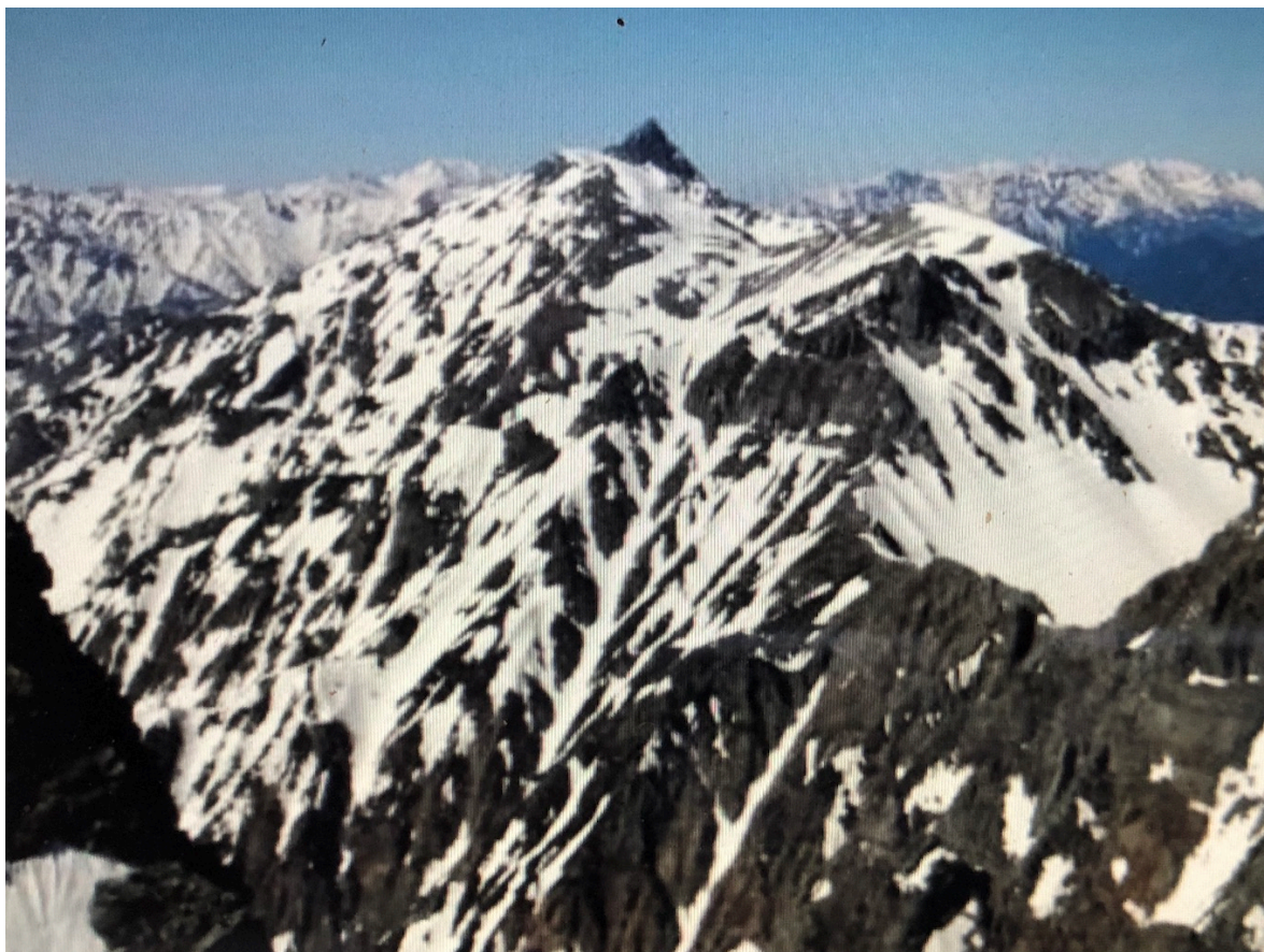
潤沢岳から北穂～キレット～槍

5月01日 潤沢(7:30)―横尾(9:30～9:40)―徳沢(10:45～10:50)―上高地(12:50～13:20)―新島々(14:25～14:45)―松本(15:15～16:58)―新宿(19:35)―東京(21:40)―新潟(23:56)