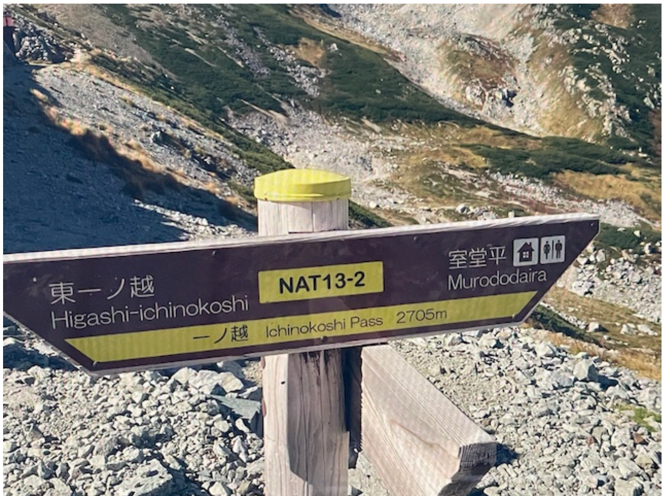
剱御前小屋に戻り、立山を縦走。